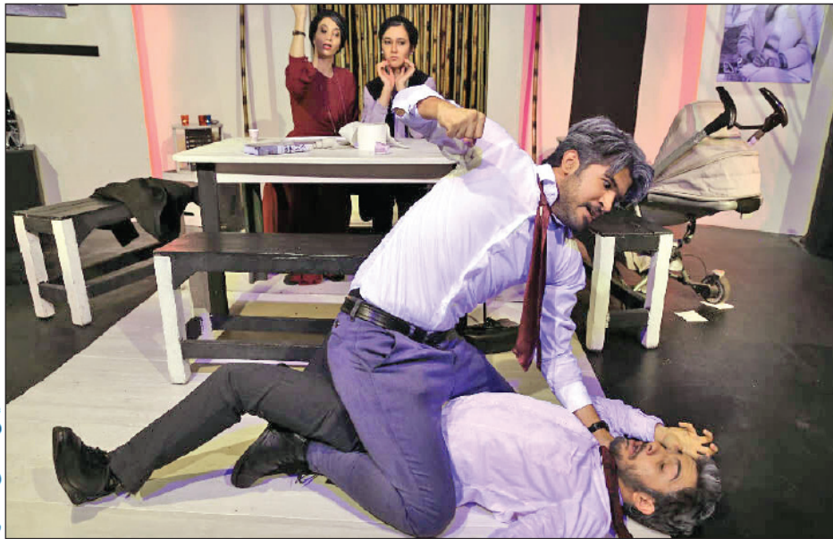
نمایش «خدای کشتار»

کاهش اعلام تعطیلی می‌کند مرکز هنرهای نمایشی است در حالی که مابقی جاها همچنان فعال هستند. به همین دلیل در هفته‌های قبل من هم تماشاخانه را تعطیل نکردم و به اجرای خود ادامه دادم و این در حالی بود که در تماسی که از سوی مرکز با من گرفته شد عنوان کردم اگر امکان هم ایراد بگیرد خواهم گفت که رستوران‌ها و دیگر مراکز فعال هستند و دلیلی بر تعطیلی تماشاخانه وجود ندارد. همین مورد نیز باعث شد برخی از تماشاخانه‌های خصوصی هم اعلام فعالیت کنند.» وی ادامه می‌دهد: «باتوجه به شرایط اعلام شده در ۶ روزی که همه ادارات تعطیل شد و با توجه به اعلام وضعیت قرمز تهران در ۲ هفته‌ای که گذشت، ما هم تصمیم گرفتیم سالن‌های تئاتر را تعطیل کنیم اما واقعا نمی‌دانم دلیل این نوع تعطیلی‌ها چیست وقتی که مشکلی را حل نمی‌کند.»