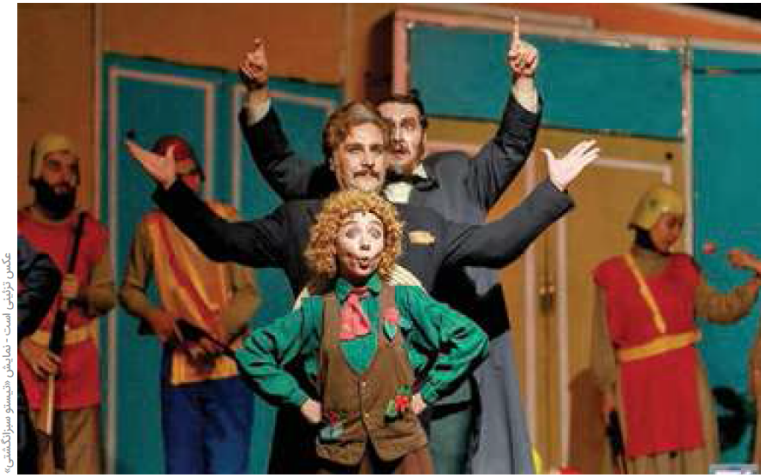
عکس: تئاتر است - نمایش: «سوسو سوزانگاشی»

ارزشی باشد. او ادامه می‌دهد: تئاتر و نمایش آیین فرهنگ یک جامعه است و می‌تواند بر آن تأثیرگذار باشد. آموزش و پرورش ناآشنا می‌شود تا تئری شگرف، عمیق و بلند مدت در ذهن و تفکر مخاطب خود دارد. به عنوان نمونه می‌توان بدین مطلب اشاره کرد که ارائه پیام‌های درست و انتقال مفاهیم تعالی برگرفته از آموزه‌های دینی و اخلاقی بسیار می‌تواند در امر این نقش آفرینی کند.