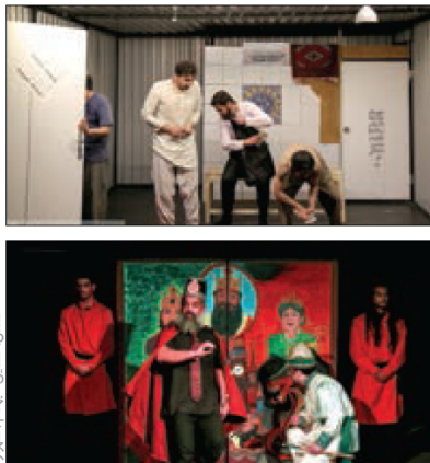
عکس: صفاغی - بهنگام تصویر