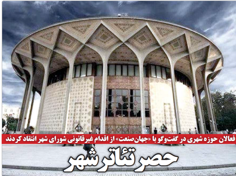
فعلان حوزه شهری در گفت و گو با «جهان صنعت» از اقدام غیرقانونی شورای شهر انتقاد کردند

تاریخ انتشار: سه شنبه ۷ دی ماه ۱۴۰۰ * ۰۹:۳۰