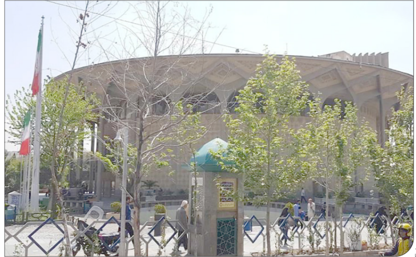
روایت‌هایی از رهگذران و ساکنان دائمی فضای پیرامونی «تئاتر شهر»