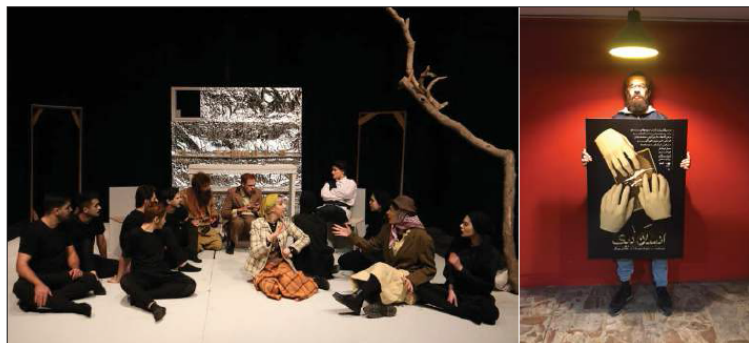
حتی خود نقش را حذف کردیم.

شما در این کار علاوه بر کارگردانی، بازی هم می‌کنید. بازیگری و کارگردانی همزمان برای شما با چه چالش‌هایی همراه بود؟ سعی کردم یکی از نقش‌های کوچک را برای بازی انتخاب کنم اما بعد از مدتی پشیمان شدم، ولی راهی نداشتم و مجبور بودم ادامه دهم. مهم‌ترین چالشم در این راه این بود که یک تیم بازیگری بزرگ باعث می‌شد نتوانم روی بازیگری تمرکز داشته باشم. این اتفاق درس بزرگی برآید بود که هیچ وقت در کاری که خودم کارگردانی می‌کنم، بازی نکنم. در این نمایش تقسیم به شکلی از فضای نمایش جداسازی و تمها در صحنه اول و آخر بازی می‌کنم و ارتباطم فقط با دو کاراکتر است. سعی کردم نقشی که بازی می‌کنم به اندازه‌ای نباشد که به کار لطمه بزند و تلاش کردم آن را خوب دربیابم.