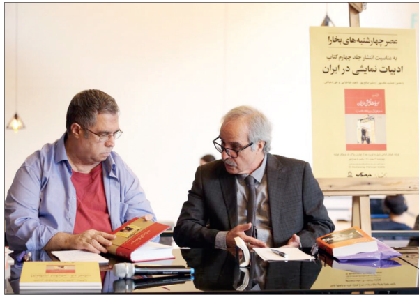
مجله «بخارا»، میزبان رونمایی از جلد چهارم «تاریخ ادبیات نمایشی در ایران»