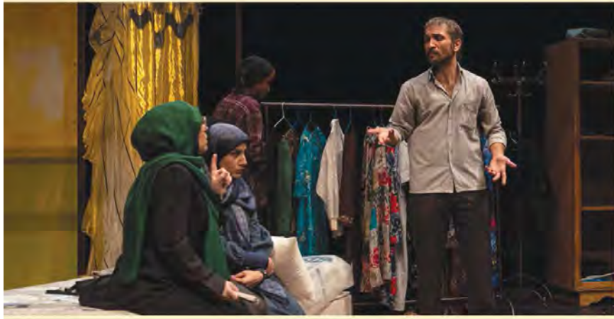
«صبح‌نو» نماینده‌های ایرانی را بررسی می‌کند