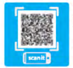
با اسکن این QR کد به صفحه اختصاصی دسترسی دارید.