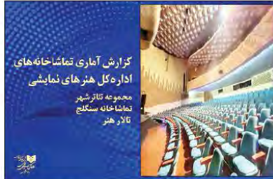
گزارش آماری تماشاخانه های اداره کل هنرهای نمایشی مجموعه تئاتر شهر تماشاخانه سنگلج تالار هنر