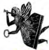
تئاتر مستقل تهران

«تئاتر مستقل تهران» با برنامه‌هایی گسترده‌تر، فعالیت‌های خود را در مکانی جدید و با نام خانه مستقل تهران از سر گرفته است. به گزارش زمان از ایسنا، آبان ماه سال ۱۳۹۹