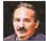
رضا آشفته منتقد تئاتر

تئاتر بسیار بیشتر از ظرفیت در اختیار تالارهای دولتی و خصوصی و از طرفی نیروهای مورد نیاز برای همراهی در تولیدات تئاتری تهران و یکی دو شهرستانی است که فضای فعالی برای تئاتر دارند. به عبارتی این تعداد خیلی بیشتر از حد نیروی سالانه‌ای است که می‌توانند به عنوان حرفه و شغل در این تالارها و در واقع فضای تئاتری فعالیت کنند، نیرویی که ظرفیت تئاتر کشورمان قادر به جذب آنهاست کمتر از یک‌صد نفر تخمین زده می‌شود که اینها نیز اکثراً از طریق هنرجویان آموزشگاه‌های خصوصی تربیت خواهند شد. به این ترتیب، تعداد قابل توجهی از آموزش دیدگان دانشگاهی یا بیکار خواهند ماند یا اینکه در صورت برخورداری از قدرت و توانایی ورود به دیگر عرصه‌ها، جذب بازار مورد نیاز سینما، تلویزیون و نمایش خانگی خواهند شد. در این بین تعداد اندکی هم جذب ادارات کل ارشاد در سراسر ایران شده یا در صدا و سیمای مراکز استان‌ها استخدام می‌شوند. حتی با احتساب همه نیروهای احتمالی جذب شده به بازارهای کار یاد شده، باز هم تعداد هنرمندان مشغول به کار بسیار کمتر از آن یک‌هزار و ۵۰۰ نفری است که هر ساله از مراکز آموزشی و دانشگاهی فارغ‌التحصیل می‌شوند. به طور قطع افرادی که در این بین بیکار می‌مانند طی هر دهه، تعداد بسیار بالایی را تشکیل می‌دهند، افرادی که نه در خدمت این هنر هستند و نه کار دیگری را در پیش خواهند گرفت. البته مگر اینکه تخصص و فعالیت دیگری را آموزش ببینند تا بتوانند جذب آن کارها شوند. این یعنی از ابتدا باید سراغ این رشته‌ها و حرفه‌ها نمی‌رفتند چرا که در هنر تئاتر بنابر امکانات موجود هم به تعداد