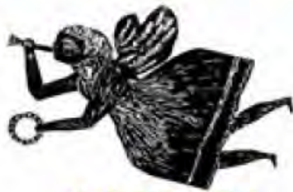
تئاتر مستقل تهران

«تئاتر مستقل تهران» با برنامه‌هایی گسترده‌تر، فعالیت‌های خود را در مکانی جدید و با نام خانه مستقل تهران از سر گرفته است. آبان ماه سال ۱۳۹۹ بود که مدیر تئاتر مستقل تهران اعلام کرد، با توجه به مشکلات پیش