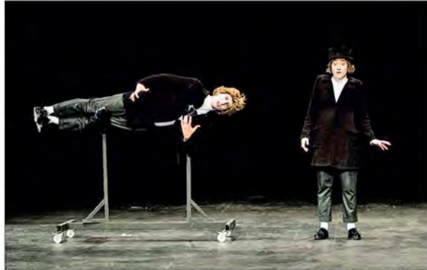
مروری گذرا بر داشته‌های فراموش شده تئاتر ایران از ۱۳۰۰ تا ۱۴۰۰

تاریخ انتشار: دوشنبه ۲۱ شهریور ماه ۱۴۰۱ * ۰۹:۴۰