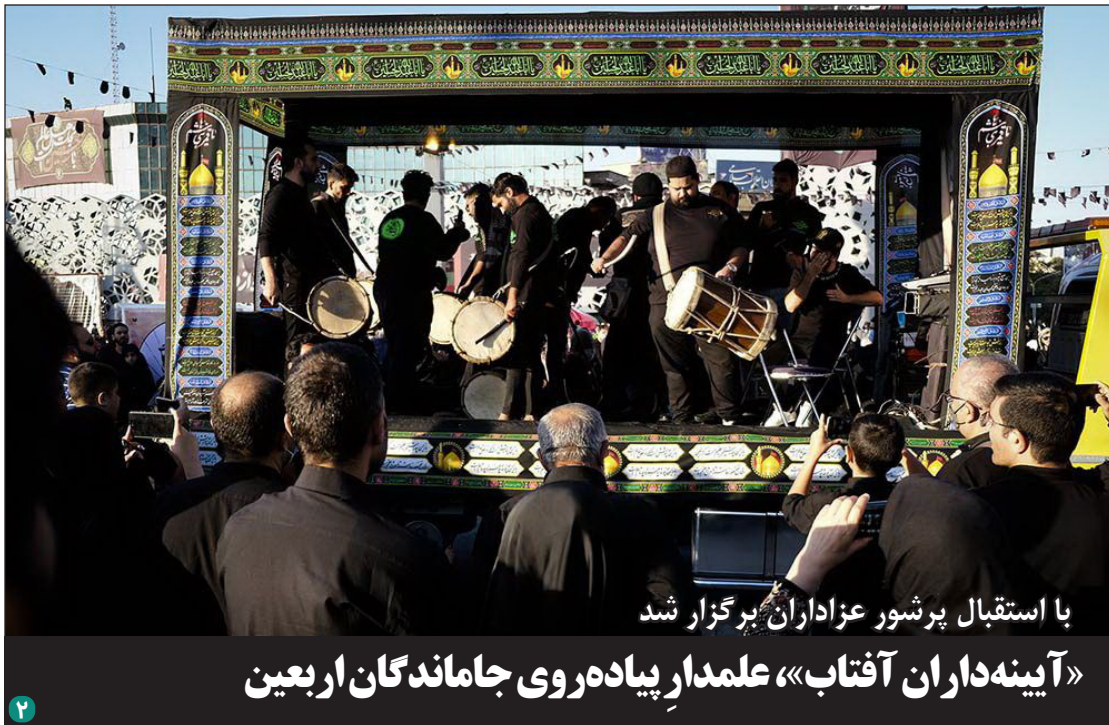
با استقبال پرشور عزاداران برگزار شد