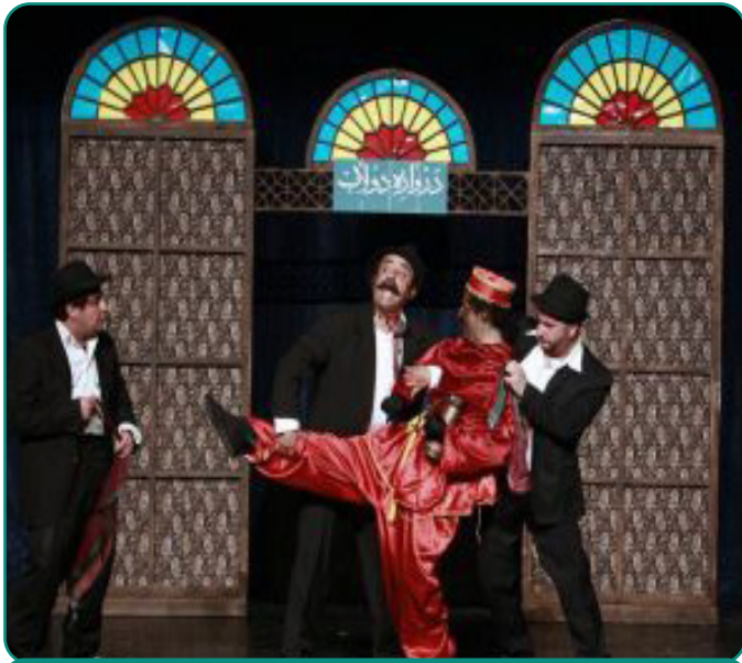
نمایش «الماس و شهرتارا» - تماشاخانه سنگلج - ۱۳۹۳

به گزارش ایران تئاتر، خانه فرهنگ میعاد با مشارکت مرکز کودکان کار پرتو در