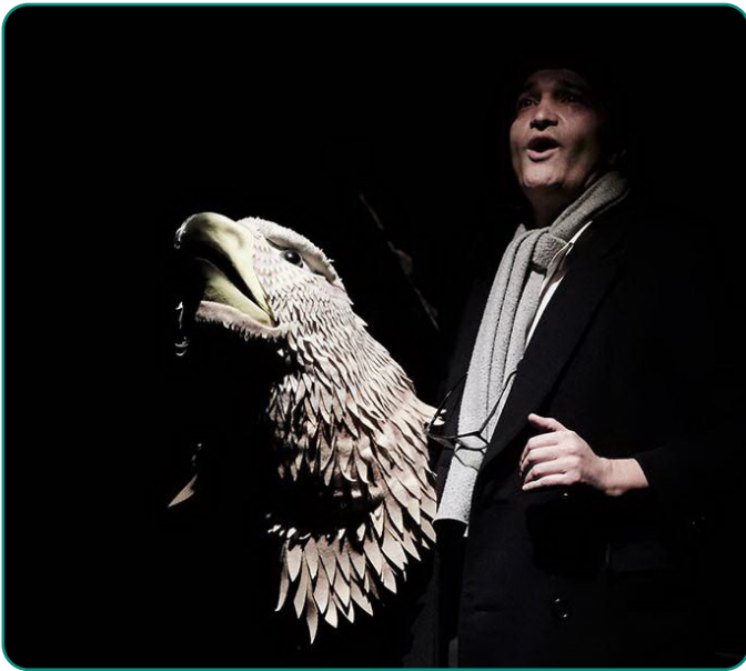
نمایش «عقاب» - تئاتر شهر - ۱۴۰۱