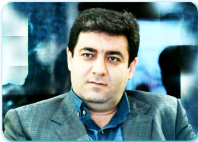
عباس زارع مدیرکل فرهنگ و ارشاد اسلامی مازندران