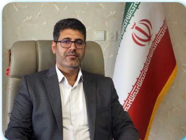
مدیرکل فرهنگ و ارشاد اسلامی لرستان، فرارسیدن روز ملی هنرهای نمایشی را تبریک گفت.